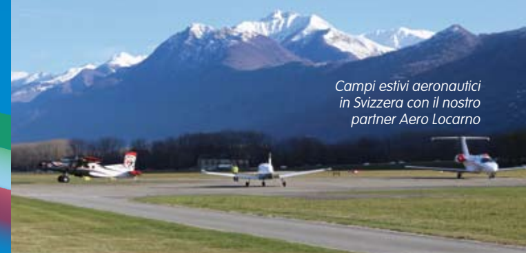
Campi estivi aeronautici in Svizzera con il nostro partner Aero Locarno