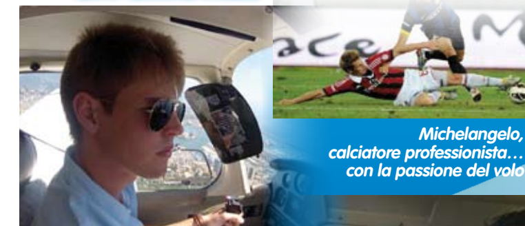
Michelangelo, calciatore professionista... con la passione del volo