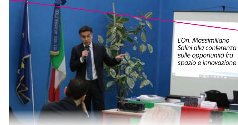
L'On. Massimiliano Salini alla conferenza sulle opportunità fra spazio e innovazione

Dal terzo anno gli allievi hanno la possibilità di conseguire la Licenza di Pilota Privato di Aereo PPL-A tramite corsi ad hoc promossi dall'Istituto e svolti in sinergia con la scuola di volo Aero Locarno.